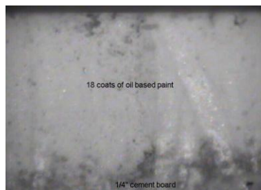
18 層の油性塗料を塗装した試験体